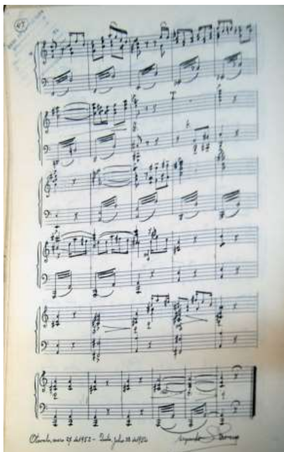
Gavilánez Daylen, 2015

Imagen 2. Foto editada de la última página del segundo ejemplar de la reducción para piano de la Suite N° 3, Movimiento V, Sanjuanito, de Segundo Luis Moreno