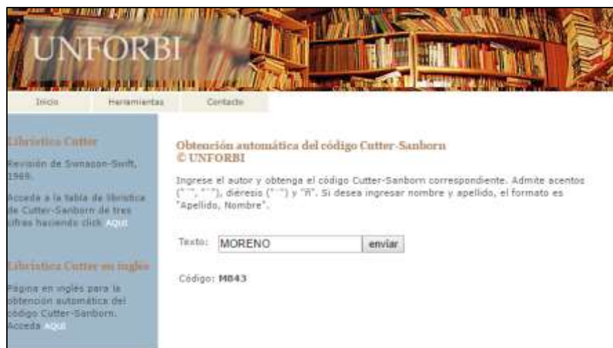
Imagen 3. Obtención automática del código de Moreno (Segundo Luis), mediante el método Cutter-Sanborn.