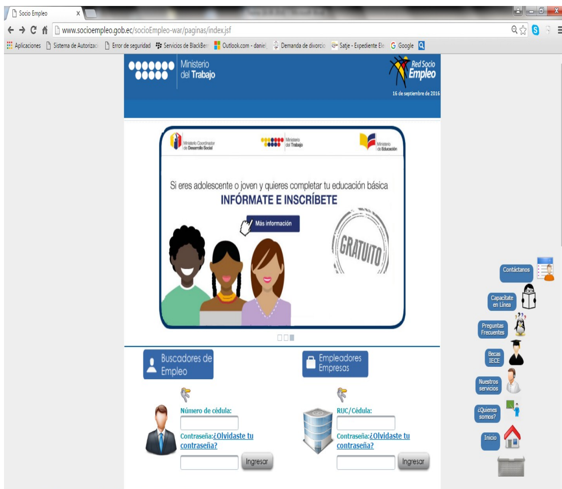
Ilustración 2. Portal de acceso a la Red Socio Empleo, del Ministerio del Trabajo, Ecuador.