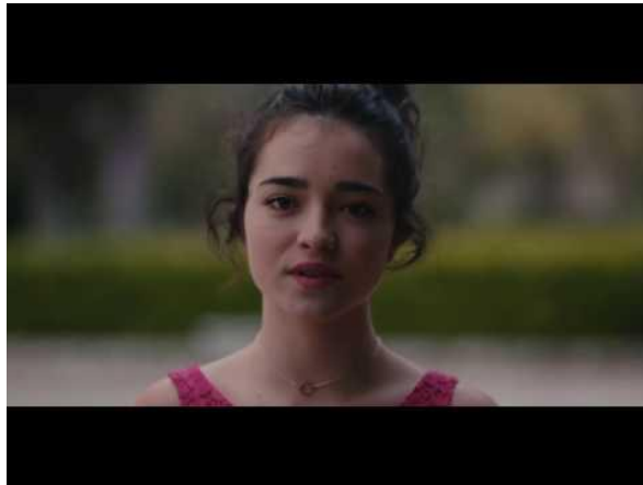
Figura 1 video sobre los peligros de las redes sociales en los adolescentes. ( MOVISTAR, 2017 )

El video es una ejemplificación de Grooming, uno de los problemas que producen las redes sociales en los adolescentes, la cual es una realidad que sufren muchos adolescentes y sobre todo que están expuestos al hacer uso de las mismas.