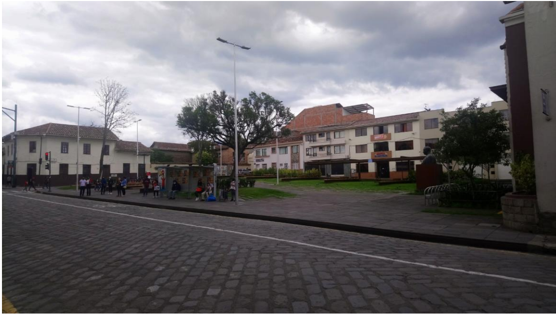
Imagen 05. Plaza Victor J. Cuesta Jaramillo. Cuenca - Ecuador (fotografía 2021)