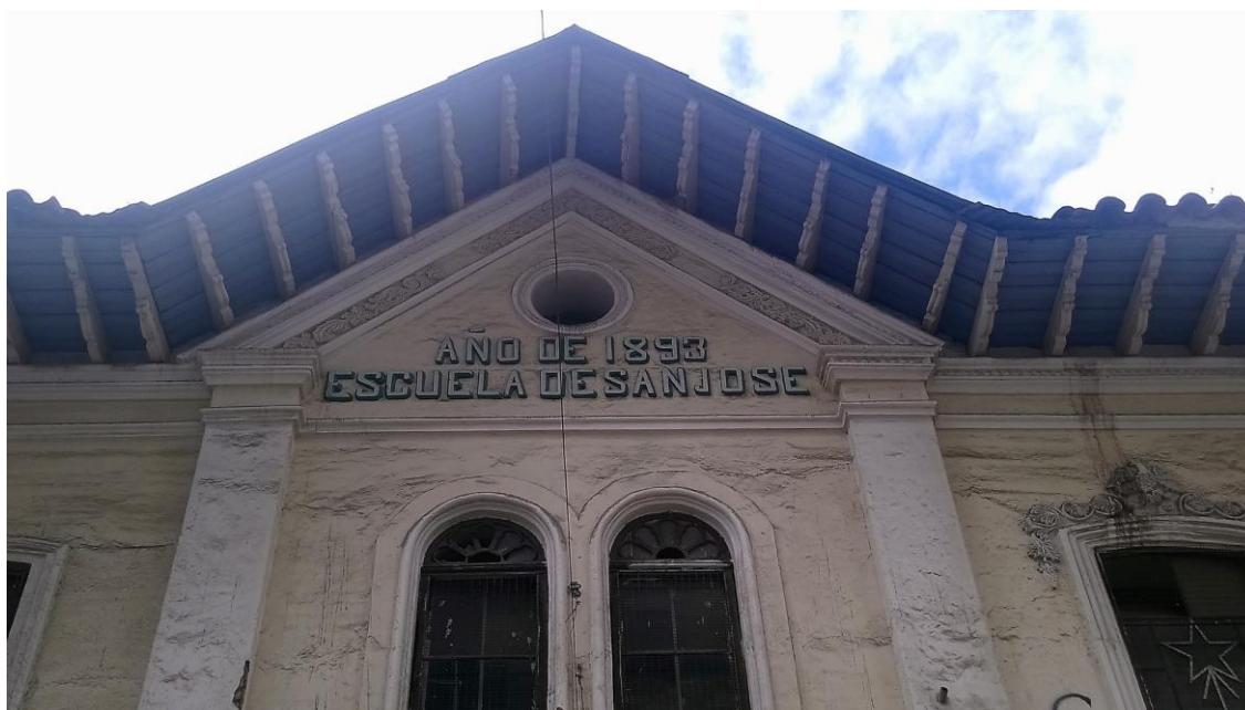
Imagen 02. Escuela de San José de los Hermanos Cristianos. Cuenca - Ecuador