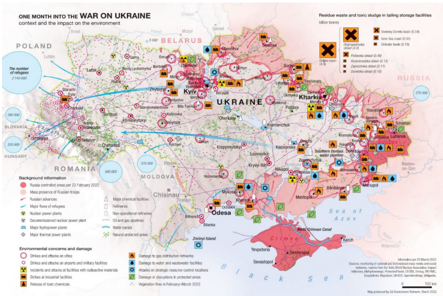
Figura No. 01: Mapa de los sectores de impacto ambiental en Ucrania

Nota. Esta figura muestra los lugares de peligro de impacto ambiental y posibles efectos en países vecinos (Averin et al. , 2022).