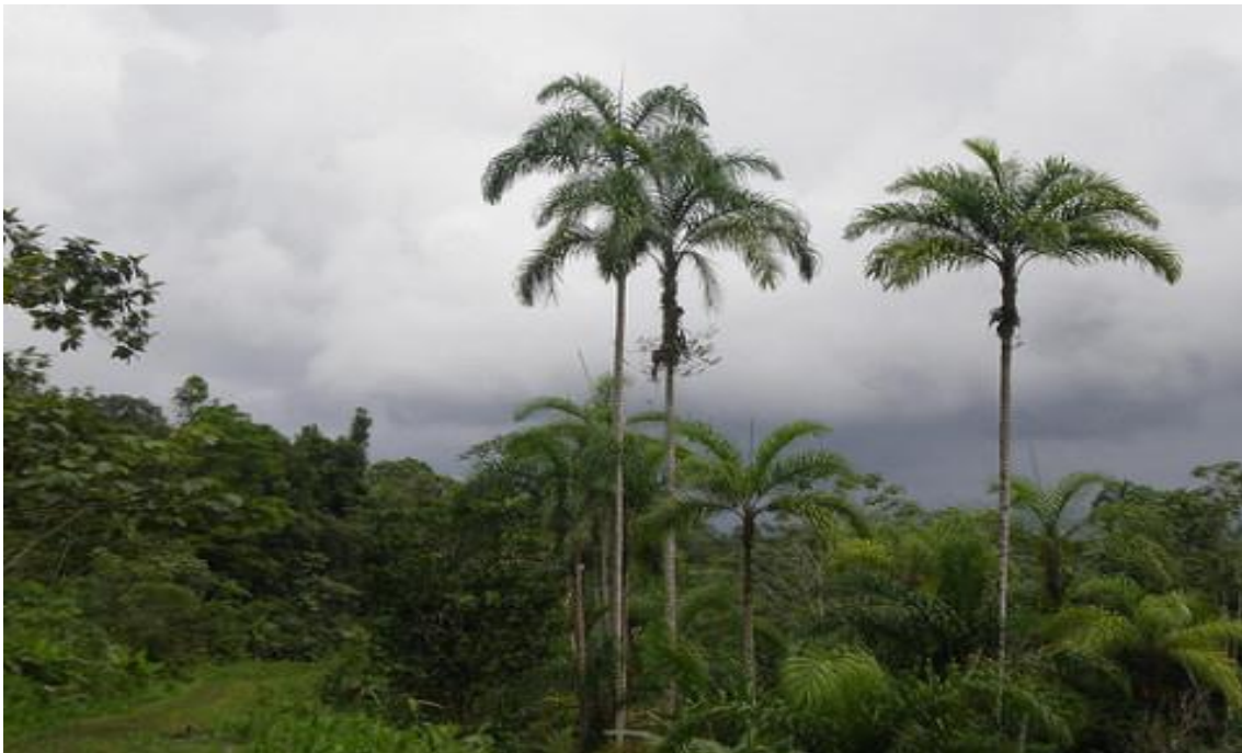
Elaborado por: El Autor

La chonta es uno de los productos más apetecidos de la Amazonía ecuatoriana, no solo por sabor de sus frutos sino por sus innumerables utilidades, como repelente contra mosquitos, alimento para animales y materia prima para elaborar artesanías. La Fiesta de la Chonta , que se celebra entre abril y mayo en la Amazonía ecuatoriana, es una oportunidad para agradecer a la tierra por la cosecha de la chonta y reunir a las comunidades alrededor de la chonta. Los dos lugares en los que principalmente se lleva a cabo esta actividad son la comunidades shuar de Morona Santiago. En la actualidad las familias poco comparten las celebraciones de estos ritos por las características diferentes que mantiene cada familia como por la economía la alimentación o la cacería. (Marquez , 2003, pág. 26)