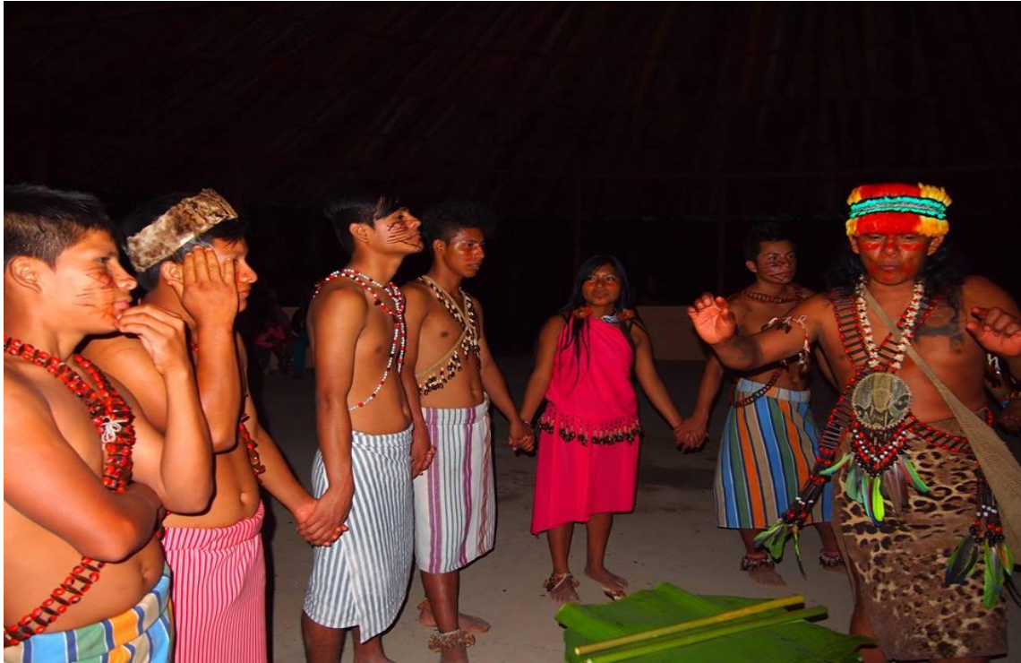
La fiesta de chonta –Uwí Ijiamma (Abril/2016)