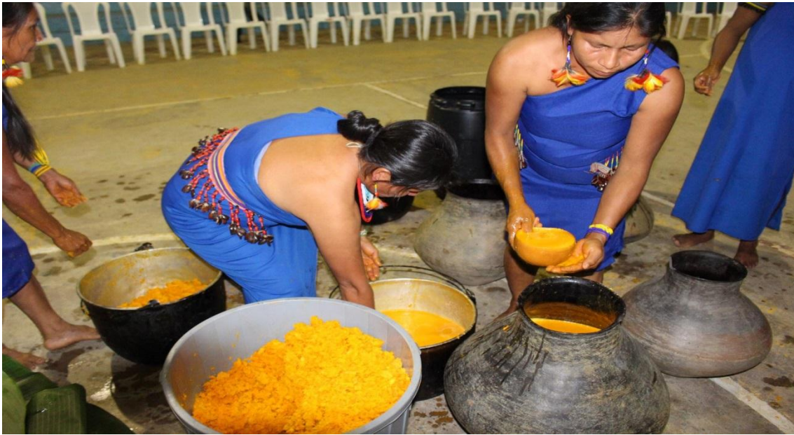
Elaborado por: El Autor