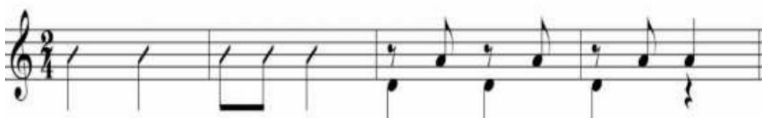
Gráfico 2. Célula rítmica del Sanjuanito