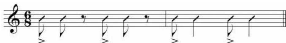
Gráfico 3. Célula rítmica del Yumbo

Este esquema rítmico tiene relación con los latidos del corazón: “Partimos de la estructura del sistema rítmico danzario desde la métrica básica del danzante y el yumbo, considerados por algunas culturas como ritmos cardiacos.” (Mullo Sandoval, 2009, p. 62).