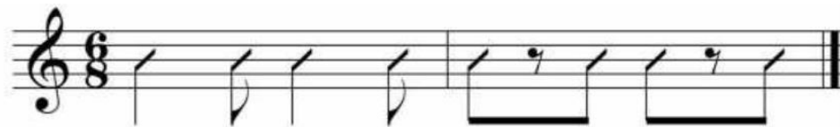
Gráfico 1. Célula rítmica de El Danzante

En la percepción psicomotora (ritmo), se captan sonidos que se representan por una nota larga, seguida por una nota corta, tradicionalmente llamado “ritmo trocaico” (Godoy Aguirre, 2005, p. 172).