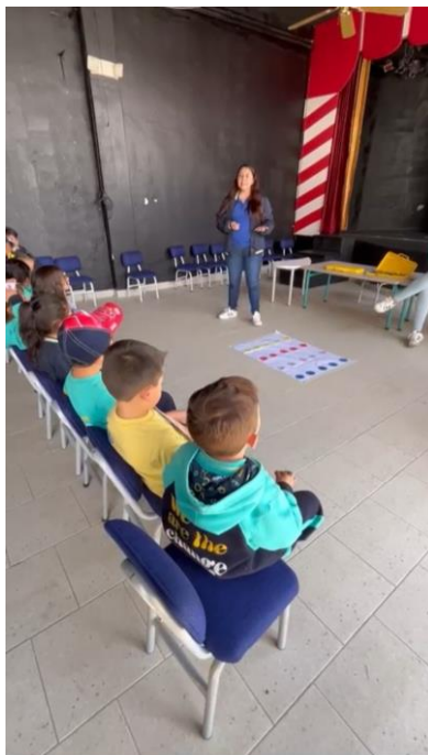
Figura 11. Aplicación proyecto interdisciplinario Primero "B"