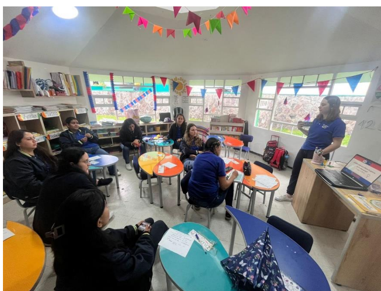
Figura 1a. Capacitación docentes primero y segundo EGB