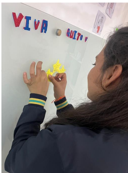
Figura 3. Lluvia de ideas docentes