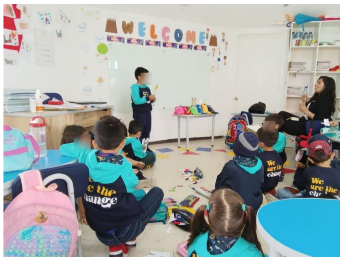
Figura 8. Aplicación proyecto interdisciplinario Segundo "C"