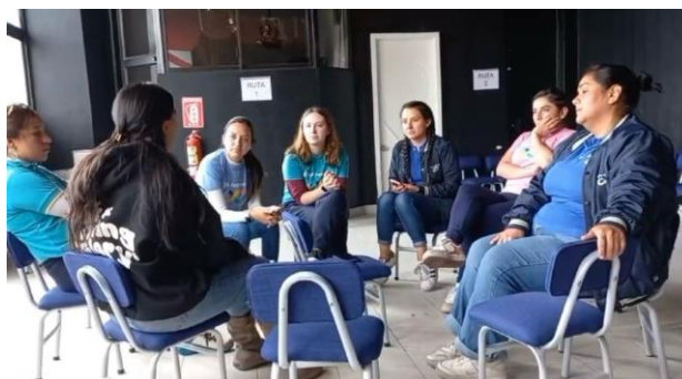
Figura 14. Focus group

¿Qué crees que son las competencias ciudadanas?