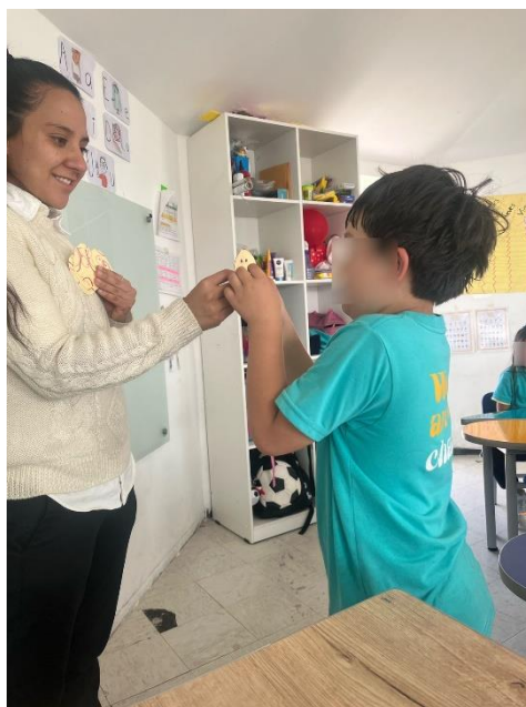
Figura 6. Aplicación proyecto interdisciplinario Segundo "B"