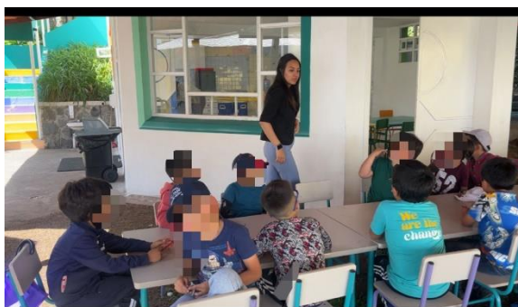
Figura 12. Evaluación estudiantes Primero de Básica