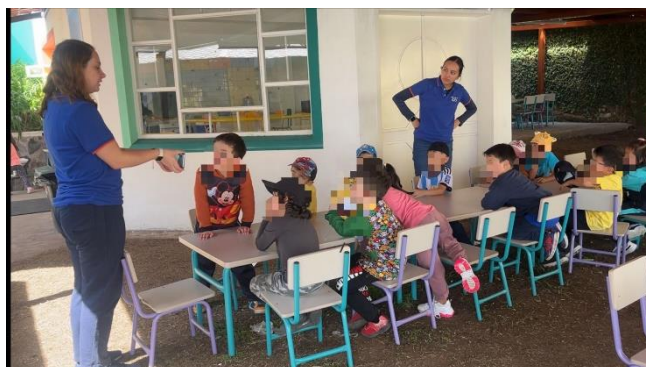
Figura 13. Evaluación estudiantes Segundo de Básica