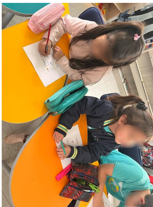
Figura 7. Actividades proyecto interdisciplinario