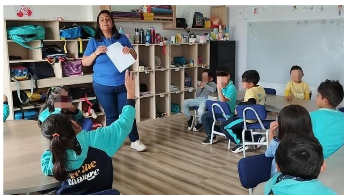
Figura 5. Aplicación proyecto interdisciplinario Segundo "A"