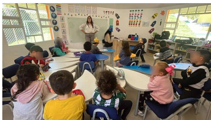
Figura 10. Aplicación proyecto interdisciplinario Primero "C"