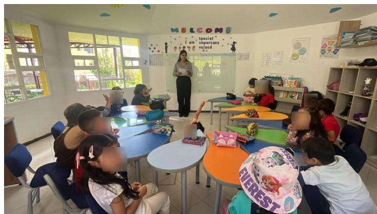
Figura 9. Aplicación proyecto interdisciplinario Primero "A"