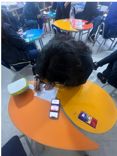
Figura 2. Realización de actividades (fase 2)