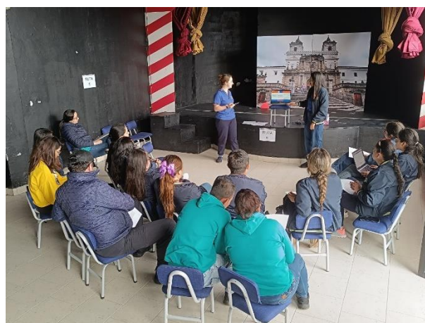
Figura 4. capacitación personal institución