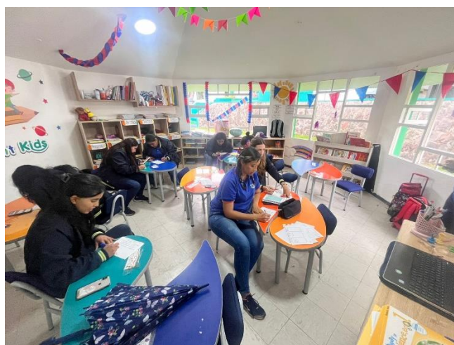
Figura 1b. Capacitación docentes primero y segundo EGB