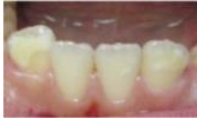
Gráfico 1. Grado 1 de HIM

Grado 1: las opacidades se limitan en zonas donde no concurre fuerza de oclusión. (Afaró, Castejón, & Magán, 2018)