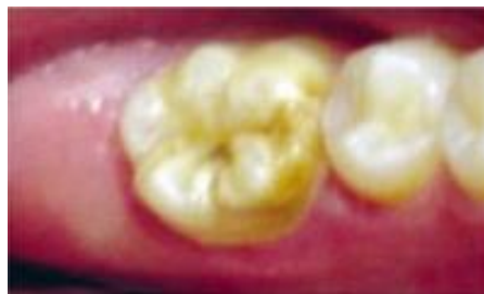
Gráfico 2. Grado 2 de HIM

Grado 2: esmalte hipomineralizado de color amarillento-marrón incluyendo en su afectación las cúspides de las piezas, en este grado existe pérdida leve de tejido y sensibilidad dental, es más frecuente hallar este tipo de manchas en el tercio incisal-oclusal. (Afaró, Castejón, & Magán, 2018)