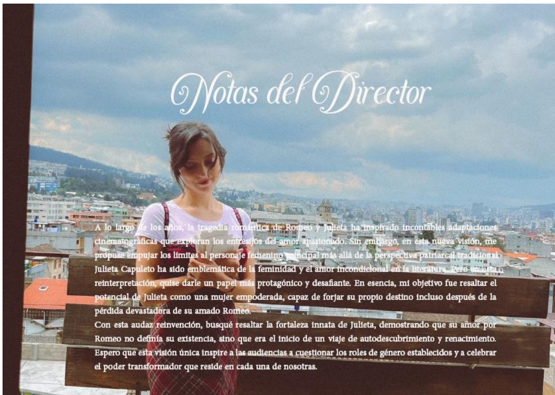
Figura 3 Notas del director