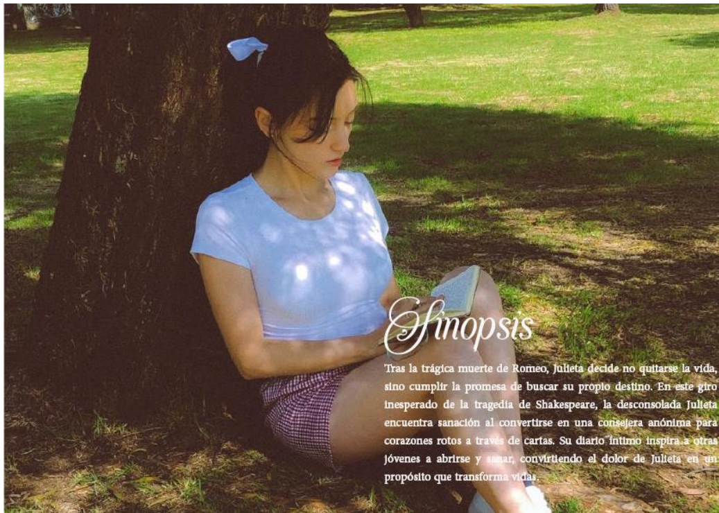
Figura 2 Sinopsis