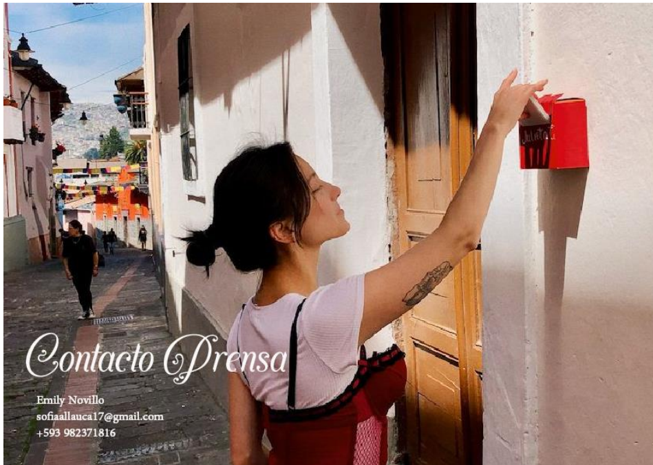
Figura 6 Contacto prensa