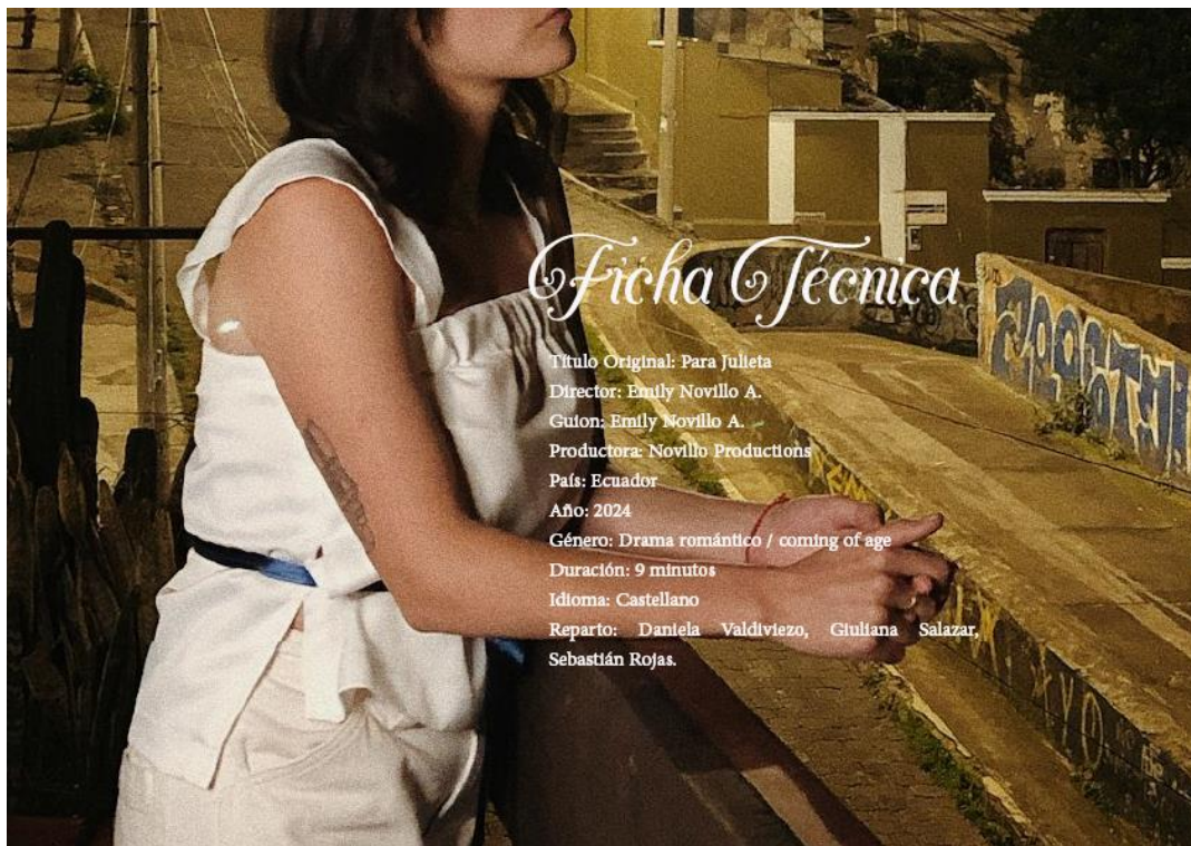
Figura 5 Ficha técnica