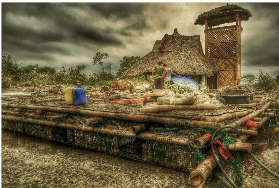
Autor: Leonardo de Luca

El héroe recogió héroes que escapaban de su mundo porque en esos mundos nadie los quería escuchar. Llegaban por mar y por tierra deseando volver a empezar. En las noches bebían tapando heridas que el mundo atravesó para generar utilidad y dinero, llenándolos de un vacío de infierno. Eran seres humanos de 25, de 27, de 30 años y de muchos más. Caminantes a medio vivir, a medio soñar, queriendo dormir para siempre, queriendo nunca más despertar. Como Alicia en sus Maravillas , parecían personajes del cuento, que buscaban dormir bajo flores que les arrulle un momento. Lloraban porque la