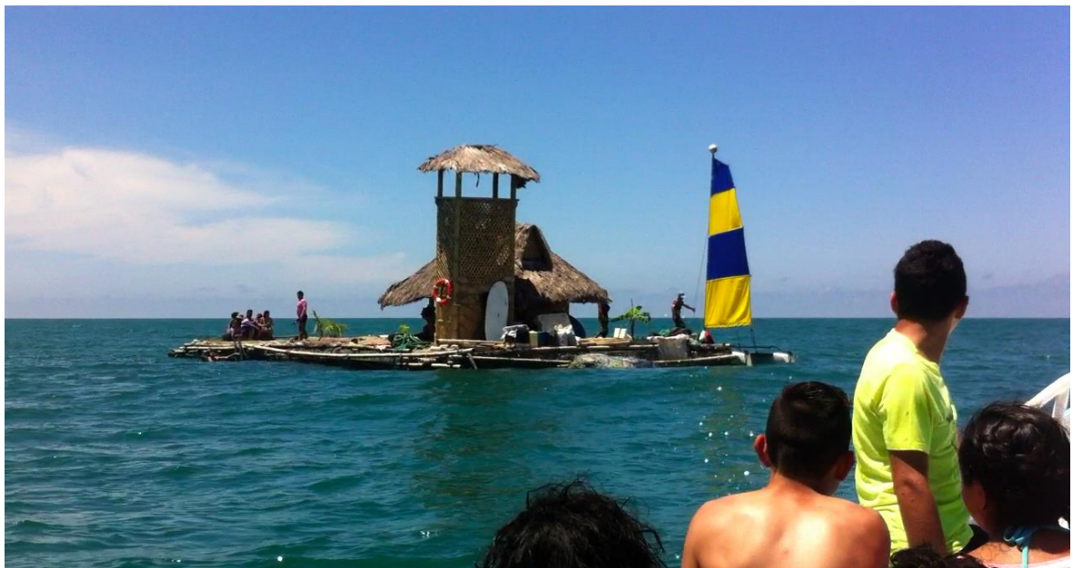
Autor: Cristina Correa Rosales