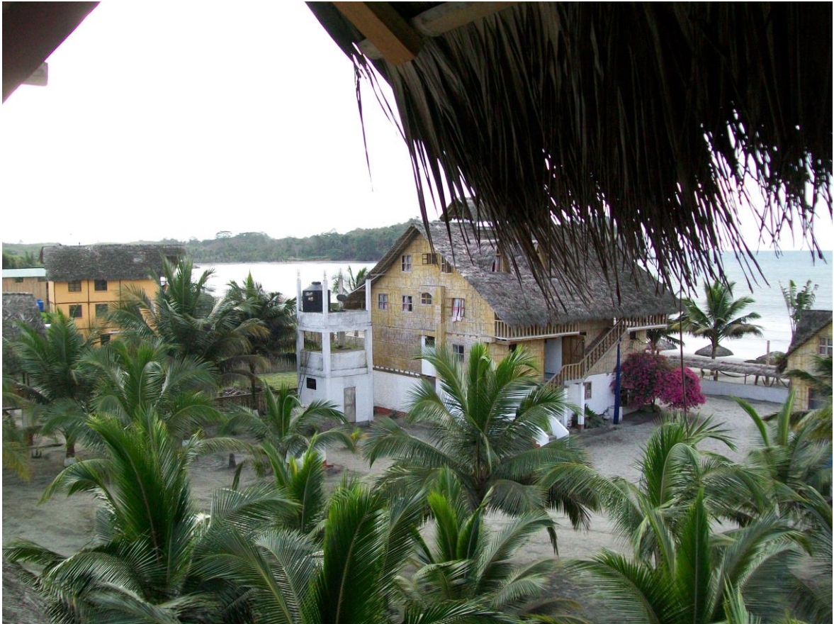
Autor: Cristina Correa Rosales

Como un gato feroz Mompiche mantenía la línea recta y dejaba que sus hijos se diviertan. Sus habitantes educaban al prójimo para darle pureza y brindarle sencillez. Fernando Suárez explicaba en ese entonces que los viajeros se quedaban por “el atractivo que es, por la tranquilidad, quieren paz y vienen a Mompiche. No hay demasiada bulla, no hay robos, no hay nada de eso; por eso, Mompiche es agradable”. Ese pueblo que parecía de cuento era real y ya no era un recién nacido porque estaba creciendo. Sus habitantes se guiaban por el bien del tigre y seguían el norte de lo correcto para hacer un Mompiche perfecto.