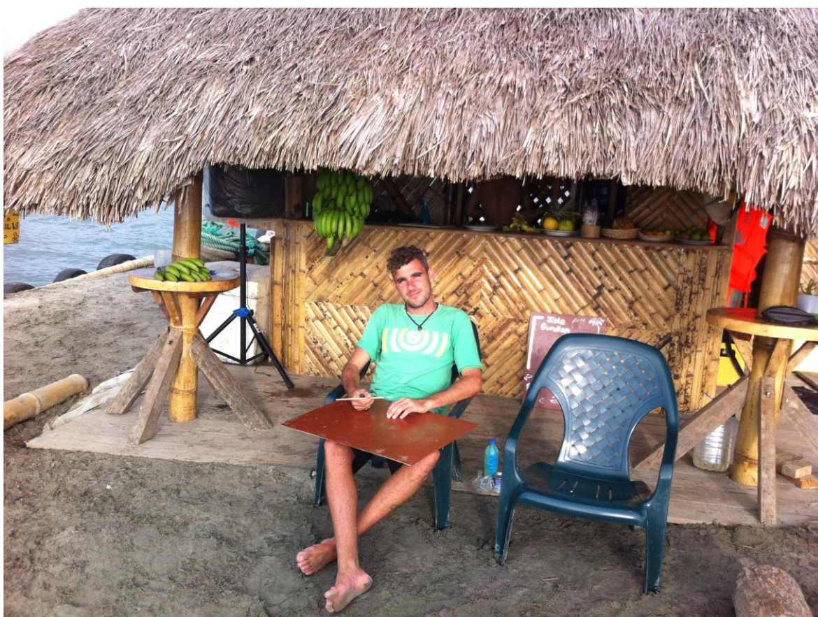
Autor: Cristina Correa Rosales

Por las mañanas y las tardes llegaban lanchas llenas de gente. Unos subían y otros bajaban, y la mayoría se quería quedar. Al llegar a la orilla de botellas Gabriel o Rodrigo estiraban su brazo. La lancha arrimada daba paso al salto del bote hacia el destino final. Al