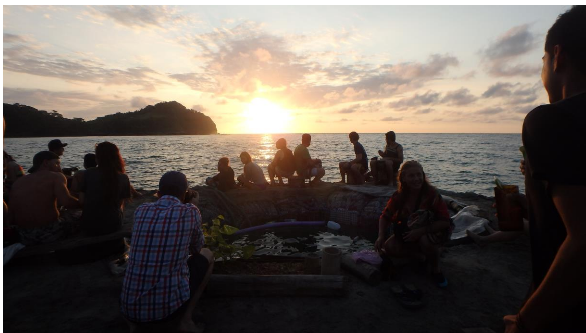
Autor: Cristina Correa Rosales

En la isla dolía el llanto y el tambor seguía contando el tiempo. Se acercaban barcos y una tabla vela para llevar a los hombres a tierra. Christian manejando la nave se acercaba: