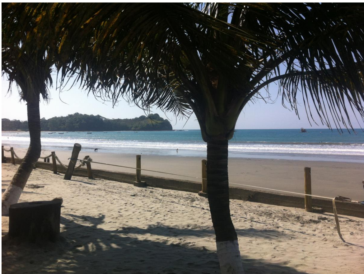
Autor: Cristina Correa Rosales

Miraba el cuento escrito por tantos en el pueblo de Mompiche y con orgullo sonreía. Era un mundo libre, era un tigre nacido para volar. Como felino animaba a los viajeros y a los nativos impulsándolos a crear.