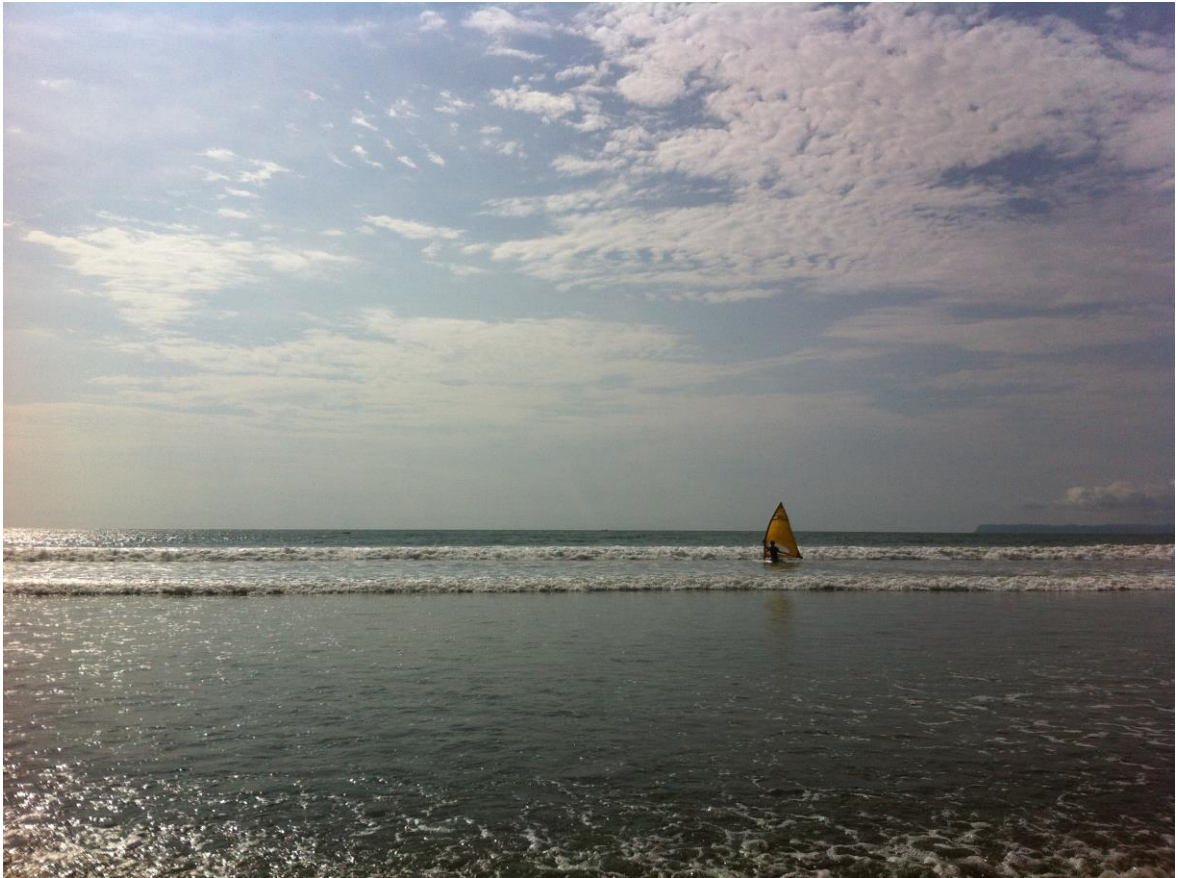
Autor: Cristina Correa Rosales