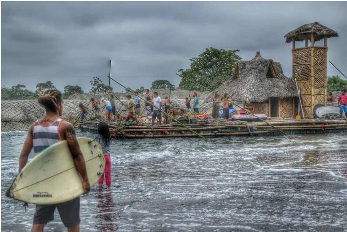
Autor: Leonardo de Luca

Gabriel había estudiado el camino para llevarla al horizonte. Lo que sucedía era que en Mompiche la marea era alta y furiosa. Las olas de surf como paredes inmensas caían despacito y destrozaban lo que tocaban. Para cruzar su línea había que pedir permiso, no se las podía obligar. La marea debía estar alta, debía abrir sus brazos para alcanzarla.