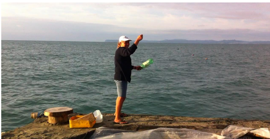
Autor: Cristina Correa Rosales