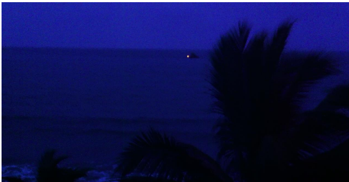
Autor: Cristina Correa Rosales

Desde lejos se veía el fuego de esperanza encenderse otra vez, en esa isla de botellas, la Isla Gurukan. El sol se despedía otro día sin querer, sin ganas de cerrar los ojos, porque quería verlo todo otra vez. La noche nacía para acurrucar a sus guerreros que dormían en la nave, meciéndose entre sueños.