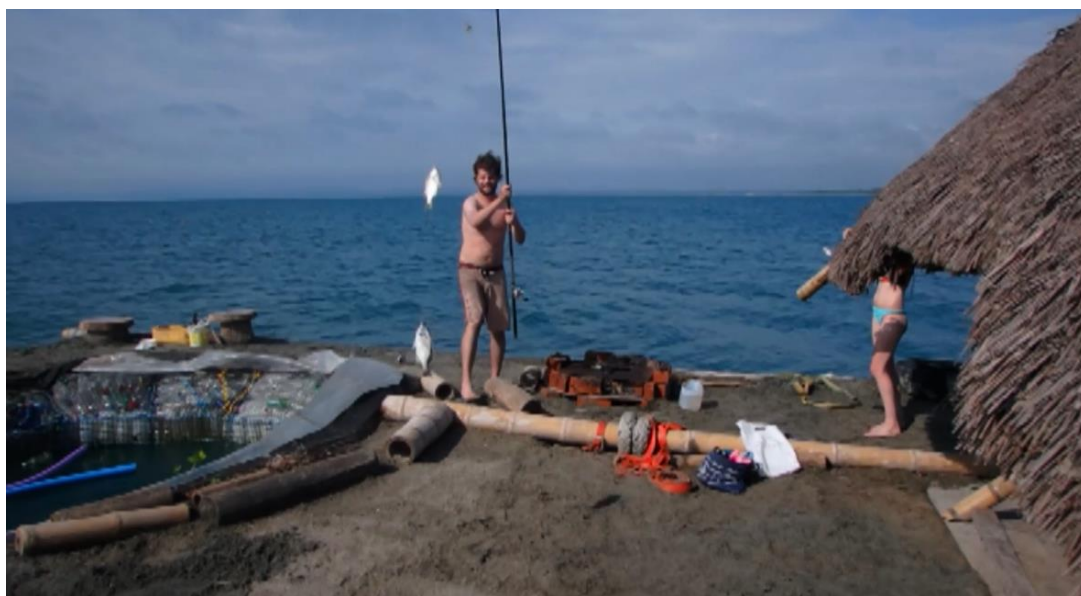
Autor: Gabriel Correa Rosales