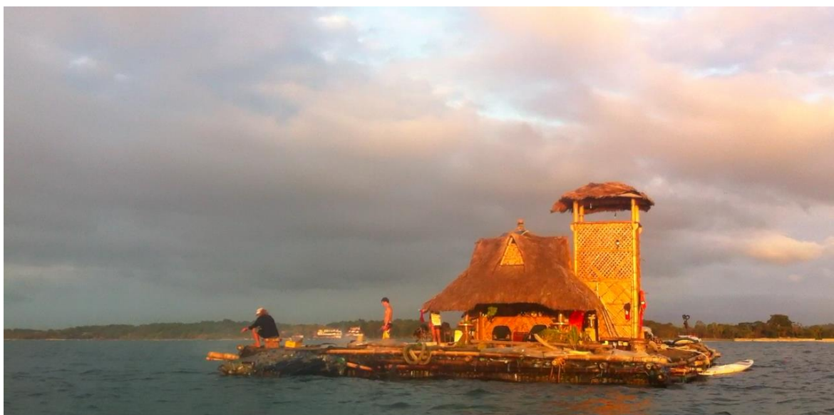
Autor: Cristina Correa Rosales

Los turistas nunca esperaban despertar de aquel sueño, pero la temporada había cerrado la puerta como lo hacía en marzo cada año. Gabriel miraba el horizonte rescatando el final de su canción: “en media hora, nadie sabía nada... de repente ya no estaba la isla en el mar, estaba guardada”. Gabriel no quiso contar al pueblo que la isla llegaba a su final, no quería hacer llorar a los que un día miraron por el otro lado. La isla era esa promesa