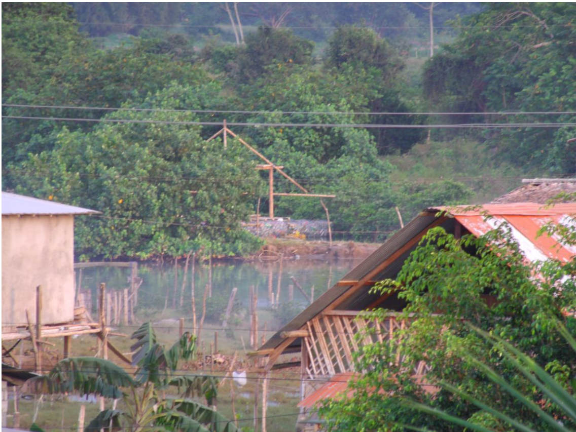
Autor: Gabriel Correa Rosales