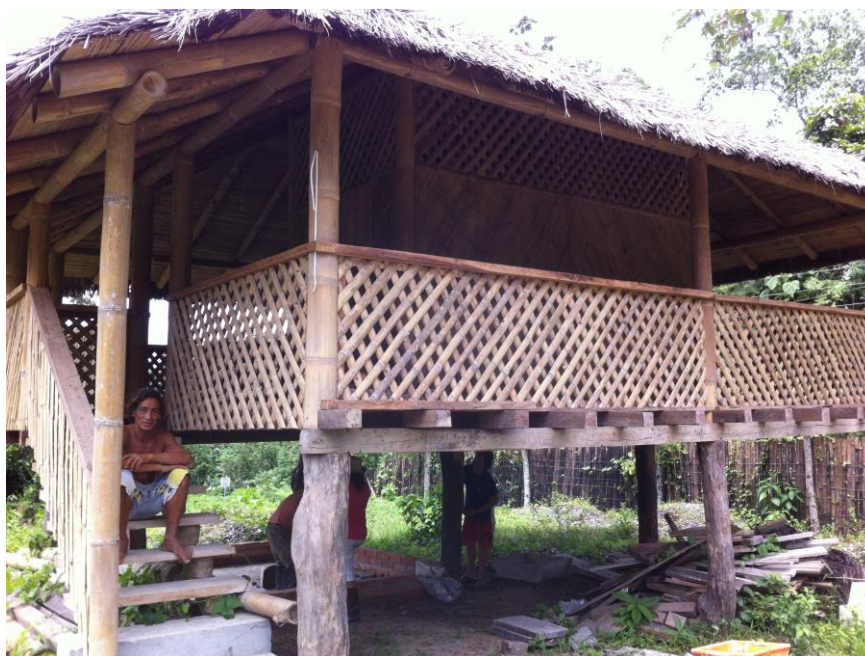
Autor: Cristina Correa Rosales

Estaban construyendo un mundo inventado y era por eso que los materiales debían atravesar ciertas pruebas. Aquella primera plataforma, de aproximadamente 10x10 metros