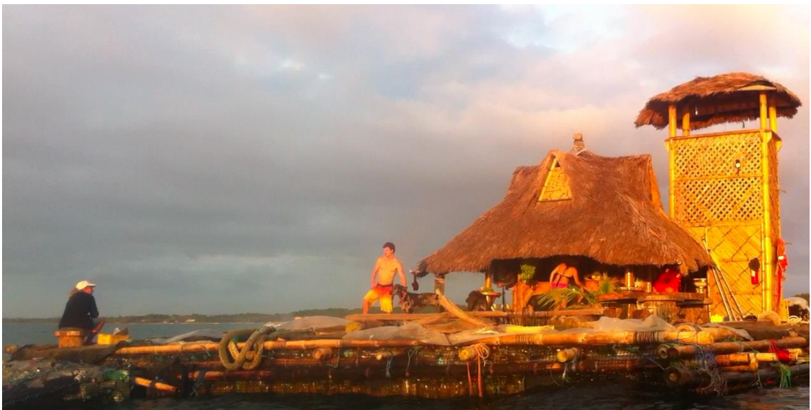
Autor: Cristina Correa Rosales