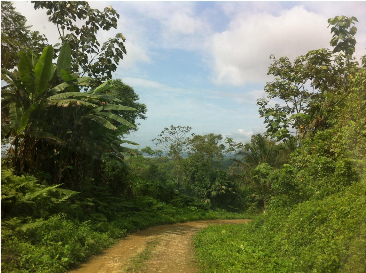
Autor: Cristina Correa Rosales

Solo los valientes cruzaban porque los ponía a prueba y ese logro premiaba dejándoles ver Mompiche. Yo atravesé ese pantano con Gabriel, nuestros padres y nuestros hermanos. Por la ventana del auto se veía de reojo un sueño. Entre las curvas el camino daba aliento y mostraba esas aguas eléctricas como de mercurio, infinitamente limpias. Era una playa sola y hermosa, como una niña jugando con mariposas. La brisa peinaba su arena, su cara mientras maquillaba una sonrisa en la orilla de sus olas. Mompiche era ese paraíso del Nuevo Mundo, de ese mundo de América Latina donde el tiempo se quedaba sin fin.