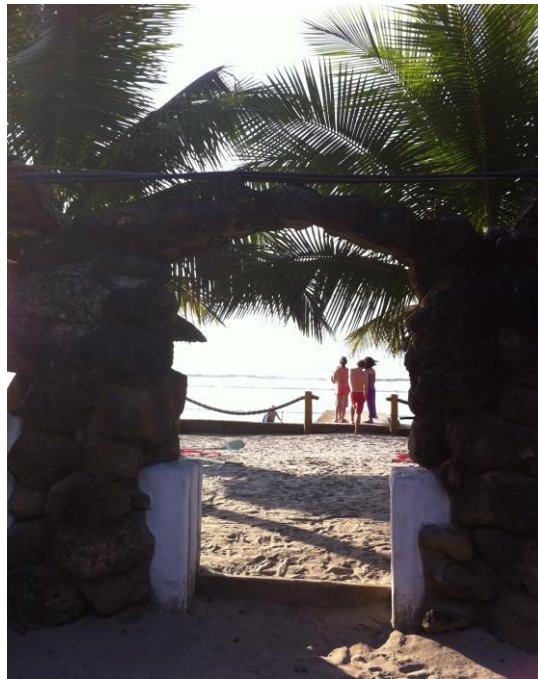
Autor: Cristina Correa Rosales

La idea de una plataforma flotante había sido soñada por muchos, muchas veces. Cuando el surfista sentía su lengua seca, e imploraba por un vaso de agua en medio de las olas, a Pablo se le ocurrió una solución. Hace mucho tiempo construyó una isla de madera para apoyar al deportista que no dejaba la corriente feroz. El surfista tenía terror y no quería dejar el juego por miedo a perder su ola. Así fue como Pablo construyó un bar en la punta de la playa. La isla de madera era una plataforma redonda que flotaba. Tenía un diámetro de 10 metros, formando un círculo. Sobre ella había un bar para brindar bebidas a los surfistas. Estaba compuesta por un casco redondo, que parecía una media luna naufragando en el mar.