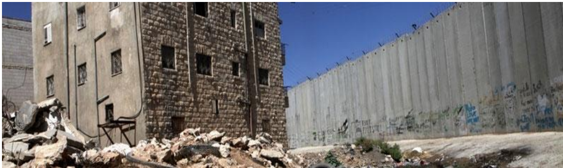
Ilustración 7. Kafri N. (2011) Los palestinos esperan cruzar a través del puesto de control de Hawara, cerca de Naplusa. [Fotografía]. Recuperado de: http://www.haaretz.com/print-edition/news/idf-to-remove-major-west-bank-checkpoint-to-enable-palestinianmovement-1.342612 .

Las restricciones a la libertad de movimiento también limitan el acceso de los habitantes palestinos a los hospitales en los pueblos cercanos, el sistema educativo sufre porque muchas escuelas, principalmente las escuelas rurales, dependen de los maestros que viven fuera de la comunidad y debe viajar a la escuela; también los lazos familiares y relaciones sociales se ven afectados negativamente” 88