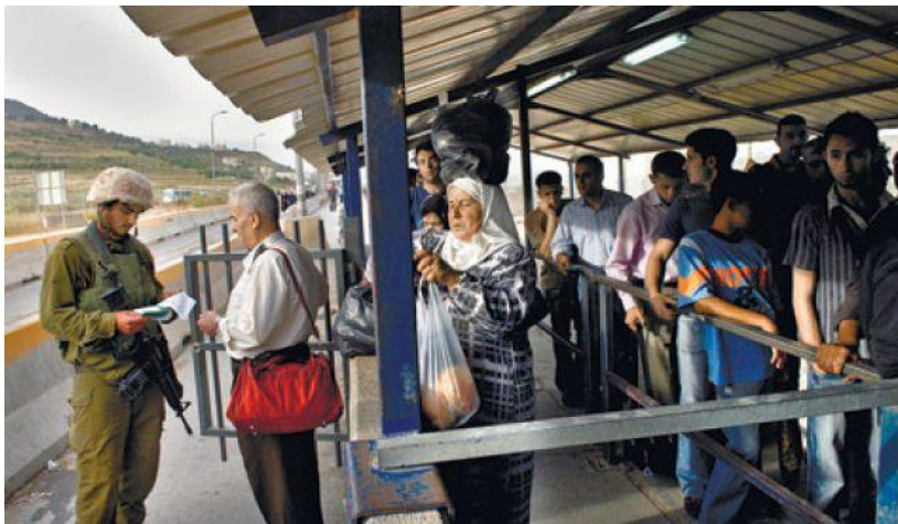
Ilustración 6. Check Points [fotografía]. (2008). Recuperado de http://www.haaretz.com/print-edition/news/idf-to-remove-major-west-bank-checkpoint-to-enable-palestinian-movement-1.342612 .

Por otro lado, sin ningún respeto “los lugares santos aparentemente inocuos como la Tumba de Rachel en Belén, la Cueva de los Patriarcas en Hebrón, los sitios en y alrededor de Jerusalén y la Tumba de José en Nablus sirvieron como pretexto para mantener “la presencia de seguridad” israelí, así como el control militar reforzado por los asentamientos” 85 .