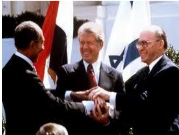
Ilustración 2: Acuerdos de Camp David [fotografía]. (1978).

simbólica, el 15 de noviembre de 1988, del Estado de Palestina” 51 previamente aprobada por el Consejo Nacional Palestino de la OLP en donde se “condeno la “amenaza del uso de la fuerza, la violencia y el terrorismo” 52 .