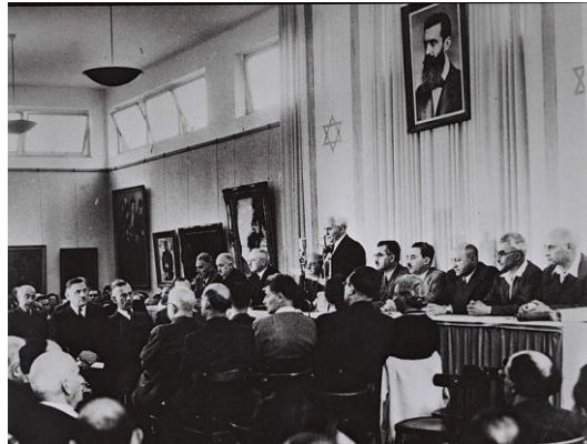
Ilustración 1: Declaración de la Independencia de Israel [fotografía]. (1948).

En la siguiente imagen se puede observar el momento en el que David Ben Gurion, Primer Ministro de Israel, lee la Declaración de la Independencia de Israel.