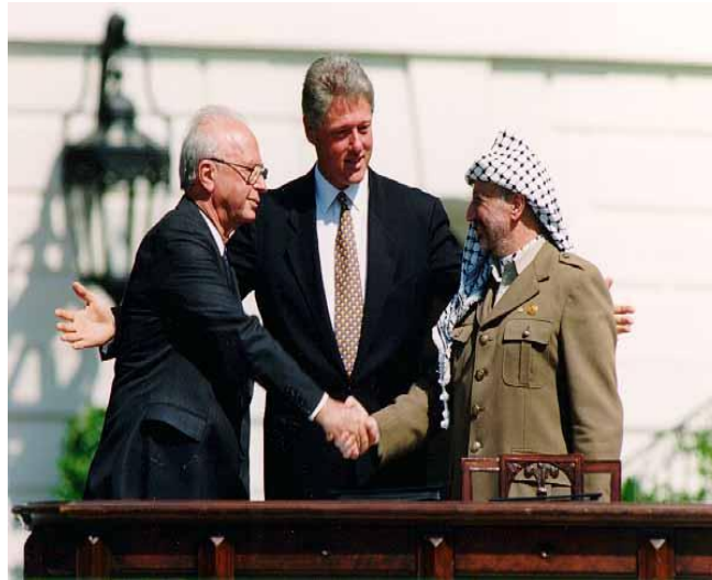
Ilustración 3: Acuerdos de Oslo [fotografía]. (1993).

aquellas partes en que negaban a Israel su derecho a existir” 55 . Por otro lado, en respuesta a lo manifestado por Arafat, “Rabin reconocía “a la OLP como representante del pueblo palestino” 56