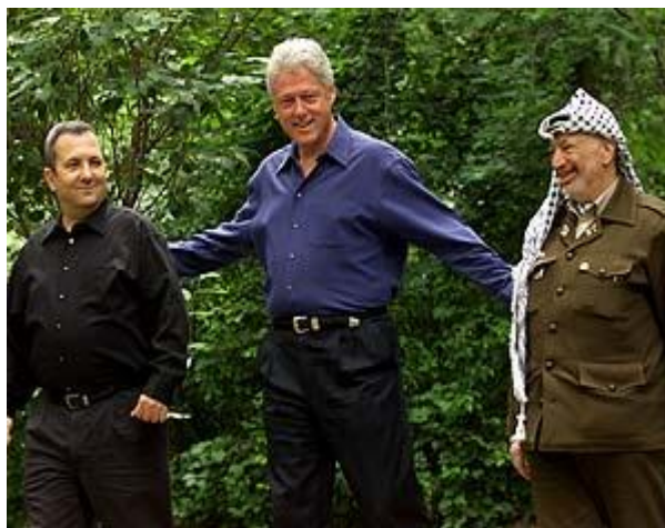
Ilustración 4: II Cumbre de Camp David [fotografía]. (2000).

Los temas que se trataron específicamente en la II Cumbre de Camp David fueron los que más afectaban a Palestina, es decir: El Estatuto de Jerusalén, los asentamientos, los recursos hídricos, la situación de los refugiados palestinos y la definición definitiva de fronteras entre Israel y Palestina.