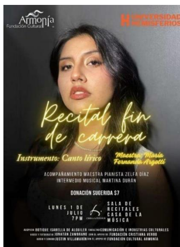
Figura 5 Arte 3 promoción recital