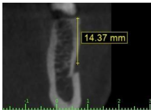
Fig. 3. Distancia del foramen mentoniano hacia el reborde alveolar