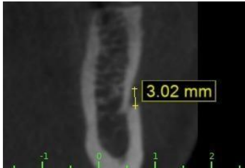
Fig. 4. Tamaño promedio del agujero mentoniano