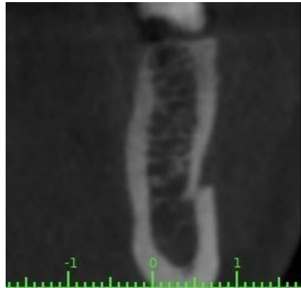
Fig. 1. Ubicación del foramen mentoniano en el plano transaxial

línea con el primer molar. Se utilizó como criterio de evaluación la forma ovalada y circular del foramen mentoniano, de igual forma se consideró la presencia de los forámenes accesorios.